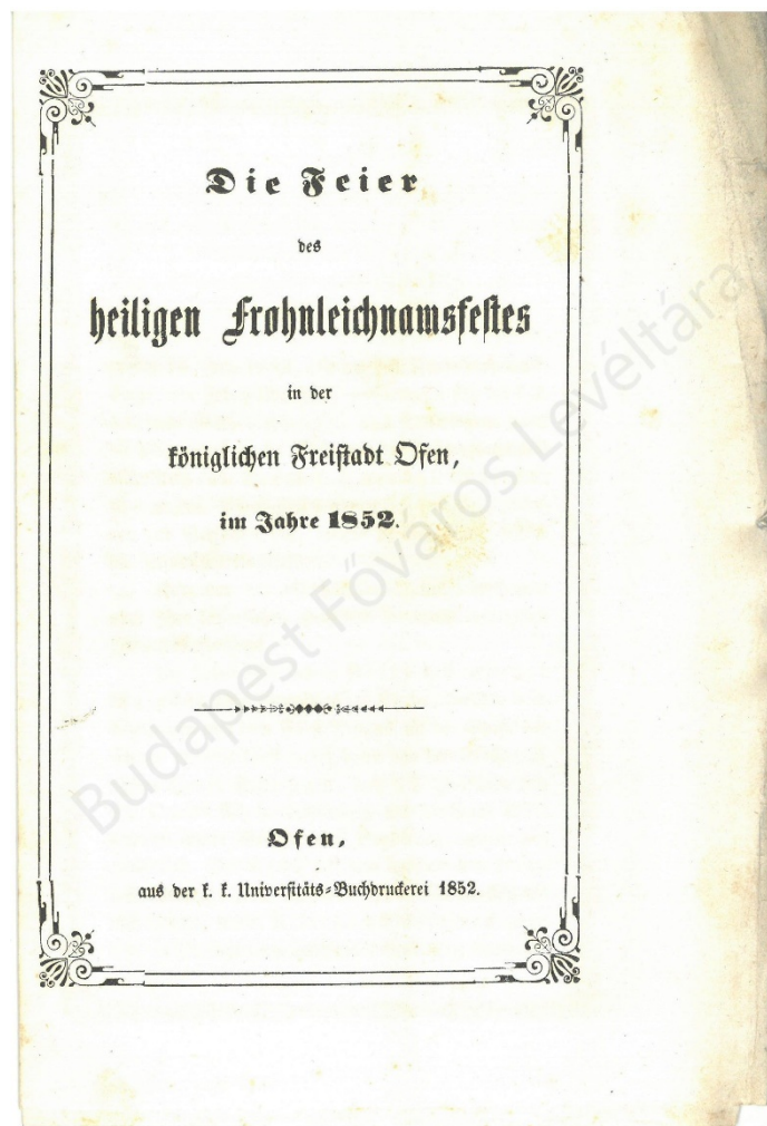
5. kép. Az 1852. évi budai úrnapi körmenet menetrendje (BFL IV.1002.j 4871–4872/1852)

A korabeli tudósítások kiemelték az ünneplő tömeg nagy számát és ájtatosságát. Megjegyzendő ugyanakkor, hogy Pesten június 13-án külön is tartottak úrnapi körmenetet, szintén Scitovszky vezetésével, azonban az uralkodó nélkül. 20