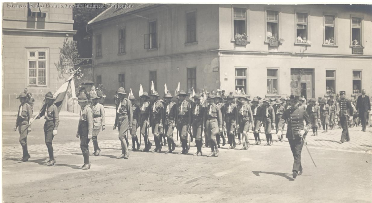
6. kép. Úrnapi körmenet a Várban. (FSZEK Budapest Képtárház, képszám: 021399 )