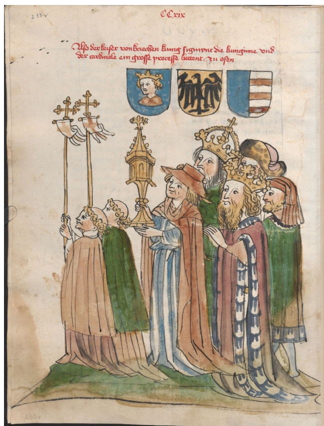
1. kép. Zsigmond király, Cillei Borbála és VIII. (Palaiologos) János bizánci császár az 1424. évi úrnapi körmeneten Eberhard Windecke krónikájában. Lauber Diebolt festménye, 1445–1450. ( Österreichische Nationalbibliothek, Handschriftensammlung Cod. 13975 fol. 233v )

Az ünnep már a 13. század végén elterjedt Magyarországon. 2 Úrnapiját a középkori Budán is igyekeztek méltó módon megünnepelni. Zsigmond király 1412-ben II. Ulászló lengyel királlyal, 1424-ben pedig felesége, Cillei Borbála mellett II. (Palaiologos) Manuel bizánci császárral – és Branda Castiglione pápai követ vezetésével – vett részt az úrnapi körmeneten a város körül ( zu ring in der Stat umb ). 3