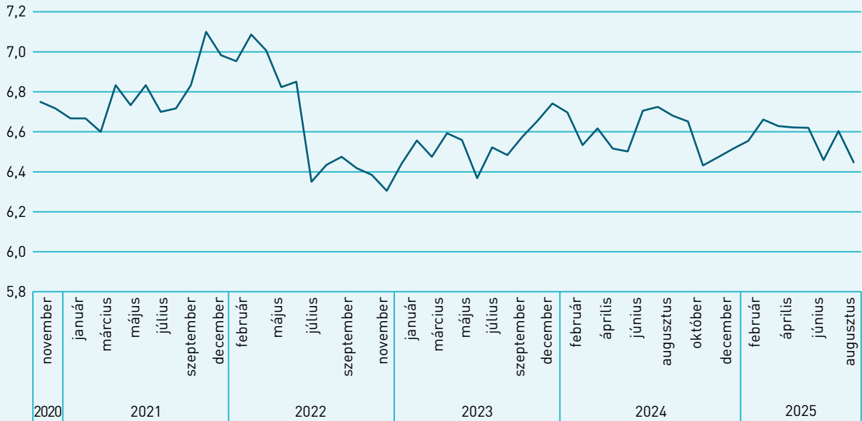
1. ábra. Az összesített közérzetmutatók (átlag)

Forrás: Omnibusz kutatások, 2020. november – 2025. augusztus. Bázis: teljes minta (N=1000), kivéve 2021. október (N = 500)