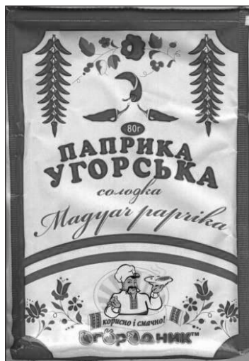
2. fotó. Magyar paprikaként hirdetett fűszerpaprika, magyar nemzeti színekkel díszített csomagolásban

A turizmus révén előtérbe került helyi értékek által egyre nagyobb presztízse lesz a helyi nyelvjárásoknak is. Akár az ukrán sztenderd mint tetőnyelv(változat) 30 alá tartozó területi dialektusoknak tekint-