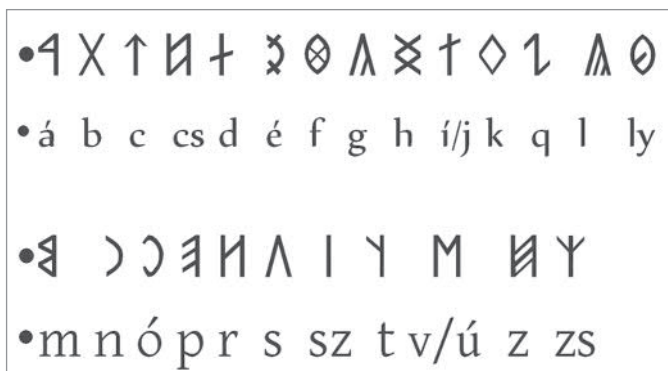
6. ábra 14. századi rovásábécé

Egyes rovásábécékben külön jele van a kemény és a lágy /h/-nak, a német ich- és ach- Lautnak, ez utóbbi a magyarban például a technika szóban fordul elő. Valójában azonban csak egy rovásbetűje volt a /h/ hangnak, a nikolsburgi ábécében előforduló, egymás fölé helyezett két x nem számítható külön betűnek. Ez eredetileg csak egy X jel volt, de több okból is az egymás fölé helyezett két x vált a fő alakká. Ha következetesen végigvisszük a 16. századi rovásábécé megtisztítását a másodlagos elemektől, előttünk áll a rovásábécé 14. század eleji rendszere (6. ábra).