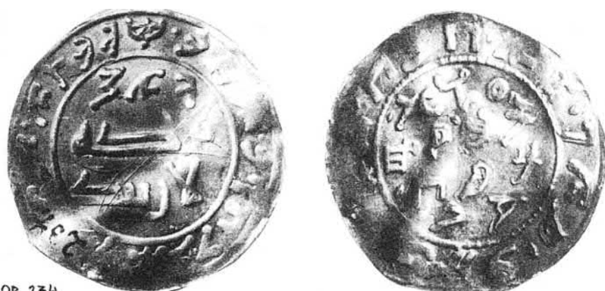
1. ábra A 817-es pénz