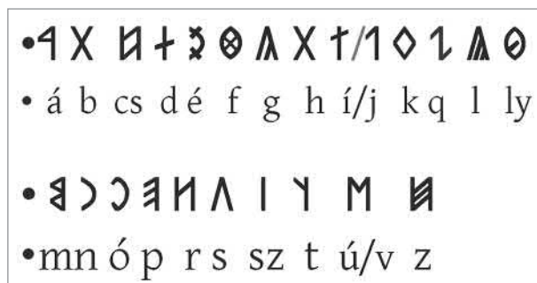
9. ábra A rovásírás 10. századi ábécéje

éve. A lelet magántulajdonban van és még publikálatlan. 14 A másik Donyecktól Északra, mintegy 80 kilométerre egy Bahmut , korábban Artamovszk nevű helység közelében szántás közben került elő a múlt évben. A két leletről egyelőre csak annyit mondhatok, hogy feldolgozásuk folyamatban van, szakemberek vizsgálják, hogy nem hamisítvánnyal van-e dolgunk. E két leletet azért említtem meg, mert azt mutatják, előbb-utóbb a kezünkben lesz az az emlékanyag, amelyben azután elhelyezhetjük rovásírásunk honfoglalás előtti rendszerét.