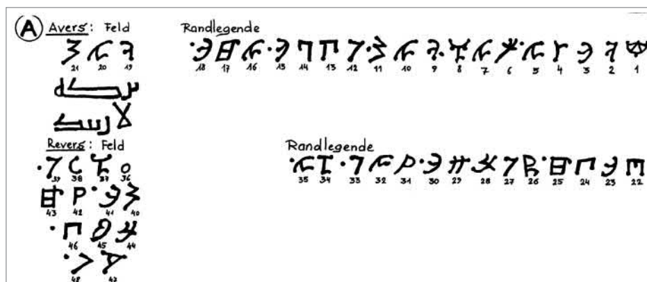
2. ábra A 817. évi pénzfelirat

udvari írássá emelésével jött létre, s korábbi változatai már a 6. századtól kezdtek megjelenni. Ezeket találjuk meg a nyugati ótörökség, elsősorban a Kazár Birodalom területén. A nyugati ótörökség emlékei közül is kiemelnék egy kazár pénzfeliratot, továbbá a nagyszentmiklósi kincs és a szarvasi tűtartó feliratait.