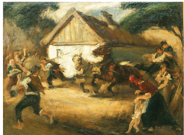
1. Tűz a faluban, 1925. Olaj, vászon, 70 × 100 cm, j. j. l. „Chiovini F. 925”. Szolnok, Damjanich János Múzeum, leltári szám: DM.70.40.1

térítő útja című freskótervéért miniszteri elismerésben részesült. 3 Megemléltendők továbbá a szolnoki (1936) és békésszentandrási (1939), templomfreskói, illetve ceglédi szekkája (1955), melyek közül utóbbi volt az utolsó jelentős szakrális alkotása. Munkásságának első korszaka a II. világháború végét követő változásokkal kényszerűen ért véget, és fel kellett hagynia azzal a nagyszabású egyházművészettel, amit mindaddig folytatott. 4 A II. világháborút követően mentalitásra való igényét a plein air festészetében teljesítette ki. „A színek harmonikus összecsengése [...] a visszafénylő árnyalatok izgalmasan élővé, mozgalmassá teszik a legkisebb részleteket is. A kontúrok oldottak, fények, árnyékok éltetik a formákat. Az a festői bravúr, ami [...] csak a legjobb Chiovini-képeken sűrűsödött, utolsó képein teljes gazdagságával jelentkezik a meglepő frissességgel, könnyedséggel készített vásznakon.” 5