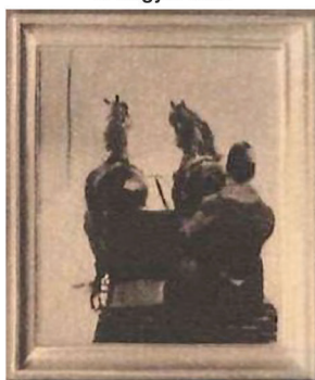
1. Magyar szán