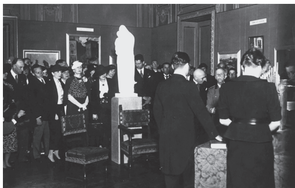
4. III. Viktor Emánuel 1936. május 16-án megnyitja a Pannonia-kiállítást és az „Ösztöndíjas művészek kiállítását”-t a Római Magyar Akadémián, többek között Chiovini festményei előtt, l. 7. kép. Chiovini Ferenc közvetlenül a király mögött jobbra hátul látható

1936. május 28-án, a kiállítás utolsó napján kora délelőtt az olasz államfő Koltay-Kastner Jenő meghívására meglátogatta az intézetet Fulvio Suvich külügyminisztériumi államtitkár kíséretében. 20 Benito Mussolini olyannyira elismeréssel volt a kiállított művek iránt, hogy aznap délután a külügyminiszter titkára megjelent, és a bemutatott katalógusból a Mussolininek leginkább tetsző munkákat megvásárolta. Az államfő által rendelkezésére bocsátott 30 000 lírás keretet azonban nem sikerült teljesen kihasználnia, ezért az összeg erejéig igyekezett minden kiállító művésztől vásárolni. Kiemelte, hogy a „Duce ezzel egyben a fiatal magyar művészeket is akarja segíteni”. Koltay-Kastner Jenő a vásárlások ellenértékét 1936. június 5-én vette át az olasz külügyminisztériumban, és 3% kiállítási költség levonása után átadta azt a fiatal művészeknek. 21 Összesen 40 műtárgy került megvételre 14 művésztől. 22 A műtárgyvásárlásról számos hazai és külföldi lap is beszámolt 1936 június közepén. 23