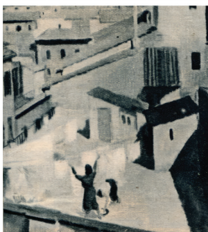
5. Római tetők