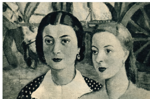
9. Olasz lányok

9. Chiovini Ferenc Rómában bemutatott műveinek elérhető reprodukciói a 16. jegyzetben idézett katalógus tételszámaival: 1. Magyar szán ( Slitta Ungherese ); 2. Római utca ( Strada Romana ); 7. Róma (Chiovini családi archívum: cinkkarc alapján reprodukálta Vásárhelyi Áron); 5. Római tetők ( Tetti Romani ); 9. Olasz lányok ( Ragazze Italiane ) – A lappangó művek reprodukcióinak forrásai: Budapesti Hírlap képes melléklete , 1936. 05. 27. ( A Római Magyar Intézet Növendékeinek Művész Kiállítása Rómában ): Magyar szán ; Képes Pesti Hírlap 1936. 05. 21., 58 (117.), képes melléklet: Római utca ; Nemzeti Magazin 1936. 05. 31. ( A római magyar akadémia kiállítása ): Római tetők , Olasz leányok