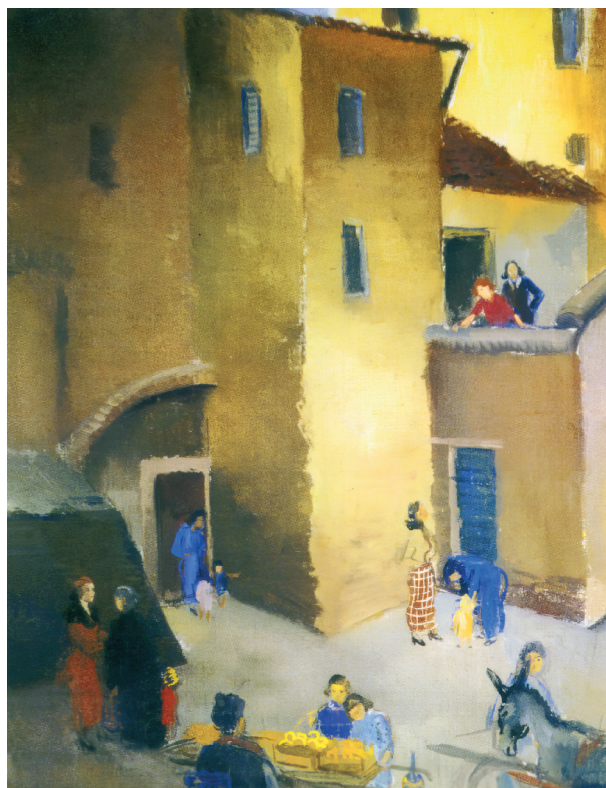
6. Római házak ( Case Romane ), tempera, vászon, 70 × 90 cm, j. j. l. Magántulajdon. A 16. jegyzetben idézett katalógus tételszáma: 10, l. 3. kép

A többi, az állam által meg nem vásárolt festmény feltehetőleg hazakerült Magyarországra. Ezek közül a „Római kettős önarckép” (8. kép) és a „Római házak” (6. kép) helye ismert. Előbbi a szolnoki Damjanich János Múzeumban, utóbbi pedig a Chiovini (Hatvani) családnál található. Ez utóbbi ellentmond a Római Magyar Akadémia igazgatója által leírtaknak, hogy ezt a képet megvette volna az olasz állam.