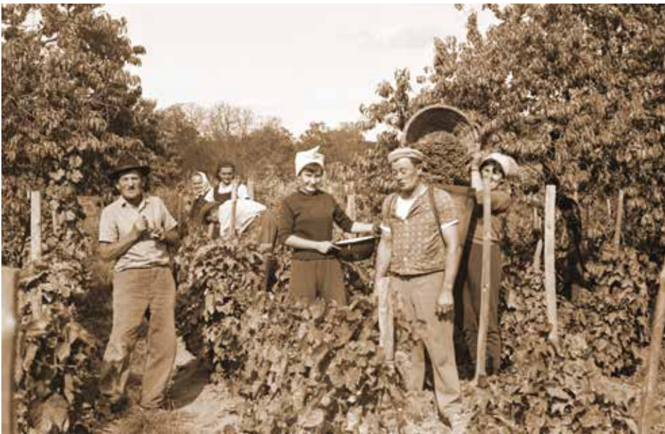
10. kép: Szüretelők. A melencébe, kosárba szedett szőlőt puttonyban hordják be a prészázba. (Fotó: Zentai János, 1966. szeptember, JPM NO 13966)