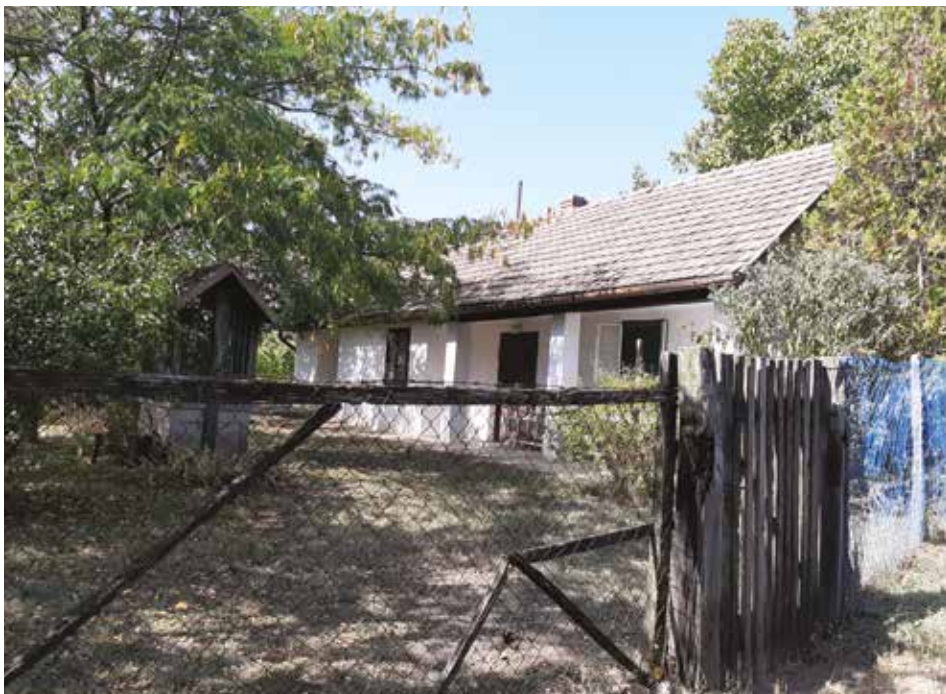
13. kép: Pécsi professzor egykori pincéje a szőlőhegyen, Diósvizlő

Összefoglalva a „hétfégi parasztok” számára a szőlőhegy és a pincék alternatív életvilágokként lényegében paraszti, sőt akár konkrétan ormánsági identitásuk megalkotott miliói, mementóhelyei, tárgyi emlékeinek raktárai, és az önellátás, a mezőgazdasági termelés gyakorlatának, valamint a természettel való aktív kapcsolatuknak menedékei voltak. Az alábbi fotókon látható szőlőhegyi porták, pincék értelmezésében annak az „elvesztett paraszti életnek” az alternatív helyszínei, melyeket évtizedeken keresztül, vagy akár máig is fenntartottak városi életmódjuk mellett.