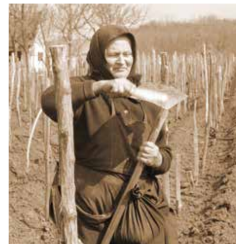
6. kép: Kapatisztítás. A kapára tapadt nedves föld letisztítása, Diósvizsló (Fotó: Zentai János, 1966. március, JPM NO 13160)