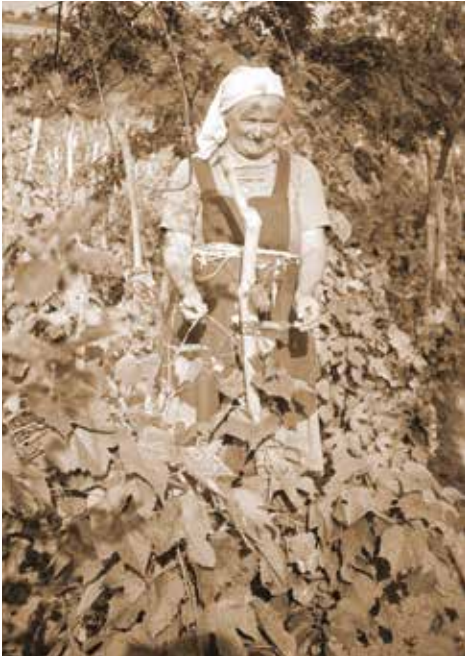
8. kép: Szőlőkötözés rafiával, Diósvizló (Fotó: Zentai János, 1966. június, JPM NO 13521)