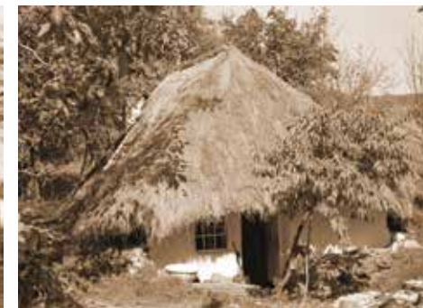
5. kép: Régi, zsupfedesű borospince a diósvizslói szőlőhegyen. (Fotó: Zentai János 1972., JPM NO 24775)