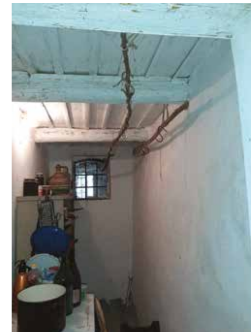
15. kép: Kamra a házi készítésű füstölt áru tárolására egy pécsi közigazgató professzor egykori pincéjében a szőlőhegyen, Diósvizlő