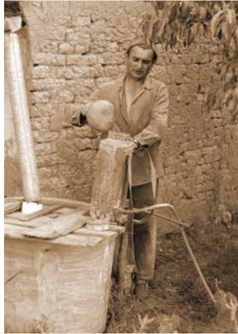
9. kép: Permetezőkanna megtöltése, Diósvizló (1969. július, JPM NO 21635)