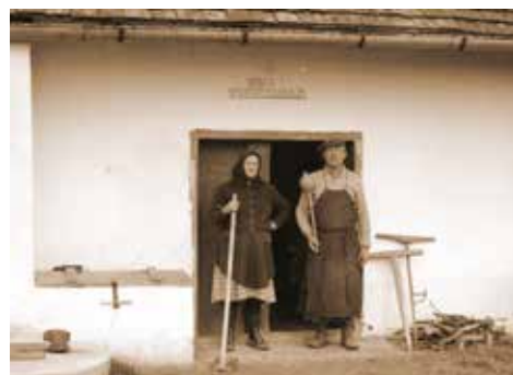
3. kép: Borospince, Diósvizsló (1970., JPM NO 13174)