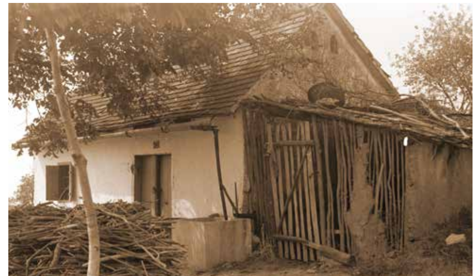
1. kép: Pince istállóval, Diósvizsló (Fotó: Zentai János 1971., JPM NO 28357)

nem kifejezetten alkalmas a szőlő- és bortermelésre, hagyományosan az itteni gazdák (is) a Villányi-hegység nyugati vonulatán, elsősorban Hegyszentmárton és Diósvizsló települések határában található szőlőhegyeken művelték parcelláikat (Andrásfalvy 2011: 319.; Zentai 1963: 363., 1978: 527). Épp a nagy távolságok miatt voltak gyakoriak azok az istállóival összeépített pincék, amelyek egyikét Zentai János fotóján láthatjuk. (Ld. 1. Kép)