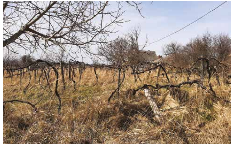
18. kép: Felhagyott kordonos művelésű szőlő, Túrnyó

Jelenleg az általam vizsgált, egykori jobbágy-paraszti szőlőhegyeken egy hagyományos, többszáz éves birtokstruktúra megszűnését és teljes átalakulási folyamatát tapasztalhatjuk, mely véleményem szerint lassan befejeződik. Mindez a 20. században lezajló, jelentős gazdasági és társadalmi változásoknak, a paraszti kultúra felbomlásának és