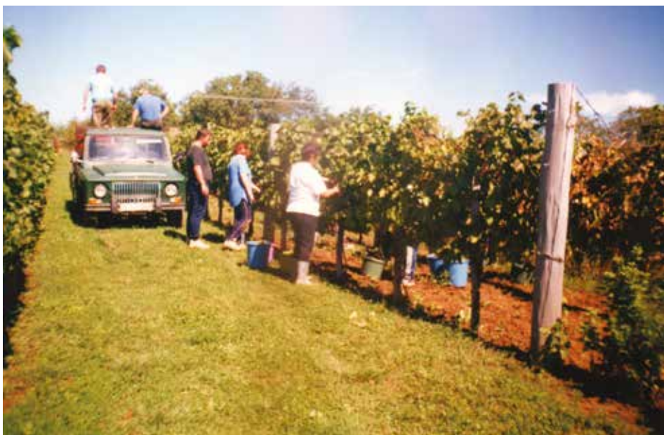
12. kép: Szüret a drávaszerdahelyi P. család pincéjénél, Szava, 1990-as évek vége