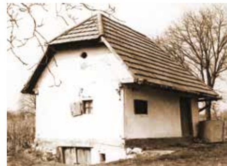
4. kép: Borospince a szőlőhegyen, Hegyszentmárton. Zentai János szerint az utolsó talpas épület, teteje már átcserépezve. Mélyszerint a présház, abból nyílik még egy szinttel mélyebbre a pincelyuk. (Fotó: Zentai János 1972., JPM NO 29267)