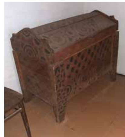
14. kép: Ormánsági szökröny a pince „tisztaszobájában”