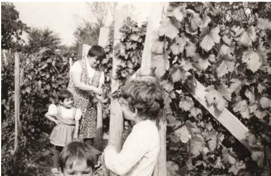
11. kép: Szüret a drávaszerdahelyi P. család pincéjénél, Szava, 1980-as évek