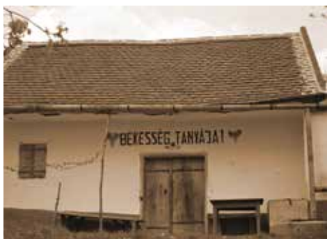
2. kép: Borospince, Diósvizsló (1970., JPM NO 24290)

A fenti tapasztalatok fényében újra átnézve a már ismert múzeumi fotókat, új megvilágításban tűntek fel előttem a pinceajtók fölötti, évszámmal ellátott feliratok, mint például: „ Békesség tanyája! 1964 ” (JPM NO 13174 és 24290); „ Csendes otthon ” (JPM NO 13517), „ Mindenütt jó, de legjobb itt. ” (JPM NO 22596). Véleményem szerint e szövegek a tulajdonosok élethelyzetére és a kisparcellás szőlők szocializmus kori sajátos pozíciójára reflektálnak. Beszélgetéseim elbeszélései szerint az 1950–60-as évek során a pince-épületeken a zsúptetőt cserépre cserélték, aminek következtében több hely maradt az ajtó és az eresz között, így ebben az időszakban terjedtek el a pinceajtók feletti feliratok.