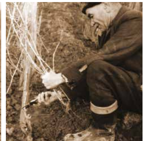
7. kép: Szőlőmetszés, Diósvizsló (Fotó: Zentai János, 1966. március, JPM NO 13177)