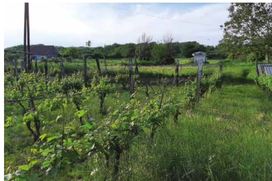
16. kép: Egy pécsi közigazgató professzor egykori szőlője, háttérben egy kicsi üvegház a szőlőhegyen, Diósvizlő (Fotó: Kurucz Réka, 2020.)