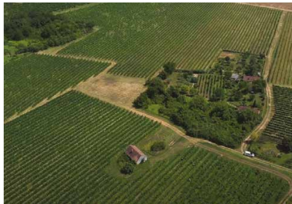
19. kép: Nagyüzemi szőlőtáblák, Hegyszentmárton (drónfelvétel, 2019.)