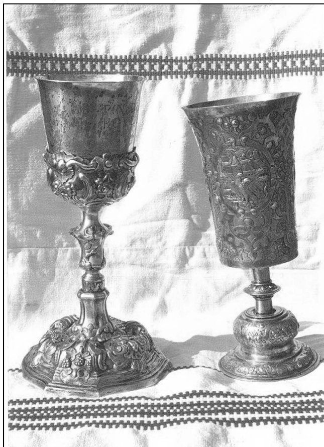
Nánási-kehely és augsburgi kehely (Köveskál)

Due to these partly noble, partly pheasant or civil bestowers, the reformed communities survived through centuries and kept their identity in spite of the secularization and the anti-clerical policy of the communist regime.