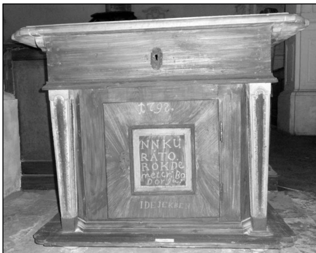
Úrasztala (Takácsi, 1792) (Pápai Református Gyűjtemények, Múzeum)