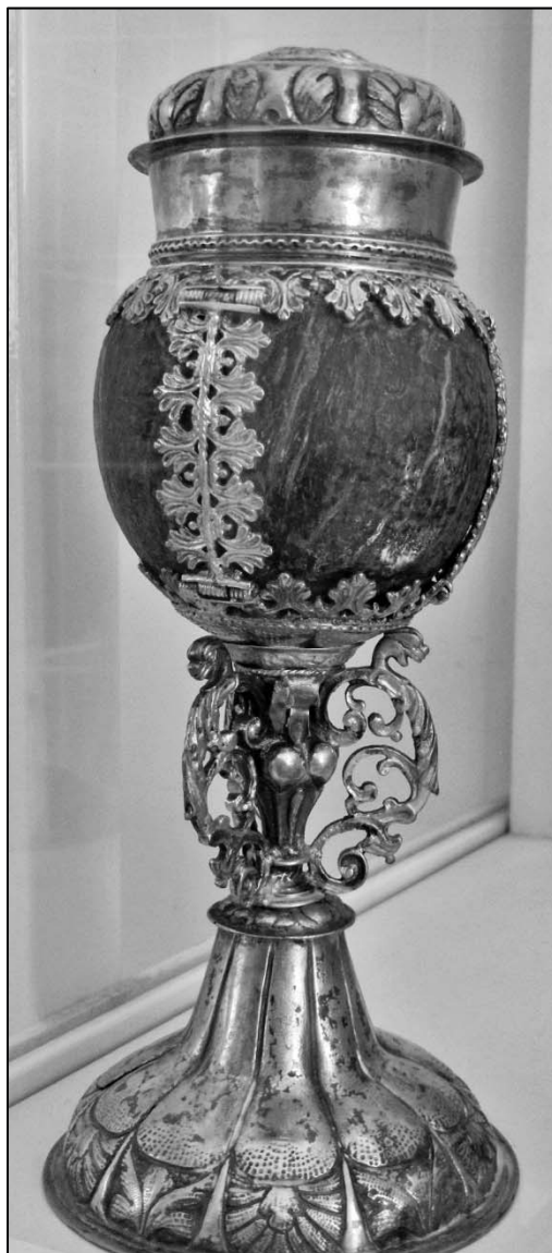
Fedeles kókuszdiókehely (Bajka, 1696) (Pápai Református Gyűjtemények, Múzeum)