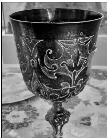
Kehely-részlet (Kéttornyúlak, XVII. század) (Pápai Református Gyűjtemények, Múzeum)