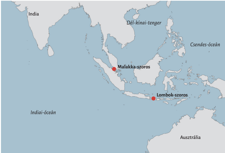
2. ábra: A Malakka- és Lombok-szoros elhelyezkedése