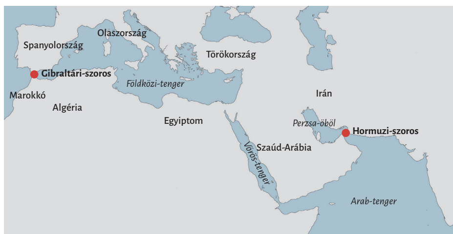
1. ábra: A Gibraltári- és Hormuzi-szoros elhelyezkedése

Idesorolható a jól ismert Gibraltári-szoros, amely az Atlanti-óceánt köti össze a Földközi-tengerrel és ezáltal a Fekete-tengerrel. Egyes becslések szerint a világ tengeri kereskedelmének mintegy 10 százaléka halad át ezen a szoroson. 3 A Hormuzi-szoros legalább ilyen, ha nem nagyobb jelentőségű Európa számára, rajta keresztül egyrészt az ázsiai áruk, másrészt a közel-keleti energiahordozók is befutnak kontinensünkre. Szakértői becslések szerint a világ kőolaj-kereskedelmének mintegy 30 százaléka halad át a geopolitikai feszültségektől sem mentes átjárón. 4 Továbbá jelenleg főleg regionális jelentőséggel bírnak még az Északi- és a Balti-tenger szorosai.