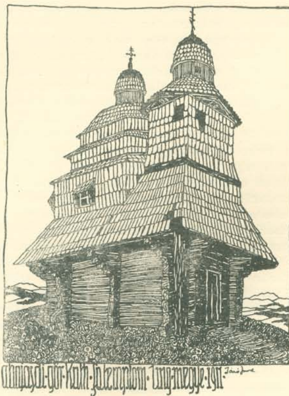
JÁRÓ IMRE RAJZA.

A Szepességen Löcsén kívül Szepesbela környékén egész sor falu van, ahol a csipkeverést üzik. Liptóban a három Szlécs a csipkeverés fészke. Árvában nemrégiben még szintén volt néhány falu,