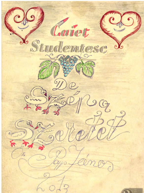
1. kép Caiet Studentesc (Diáknapló). De szép a szeretet . Papp János 2013.

Tanulmányunkban „Ördög” János – hosszabb-rövidebb írásait, rajzait, festményeit tartalmazó – irattárában található táncos ábrázolásokkal foglalkozunk. A szerző alkotó tevékenységéről egy 2007-es terepmunka alkalmával, a folyamatosan gyarapodó irattáráról pedig 2010-ben szereztünk tudomást. Gyűjteménye ekkor 13 kéziratos, gazdagon illusztrált füzetet, 67 lapnyi egyéb rajzot és történetet, valamint egy magánkiadásban megjelent 150 oldalas, a szerző orgonajátékát és karácsonyi köszöntőjét tartalmazó CD-melléklettel ellátott könyvének 5 írógéppel írt kéziratát és illusztrációit tartalmazta. A füzetek vizuális és írott forrásokat, élet- és helytörténeti visszaemlékezéseket, népi rigmusokhoz hasonlító, alkalmi verseket foglalnak magukban.