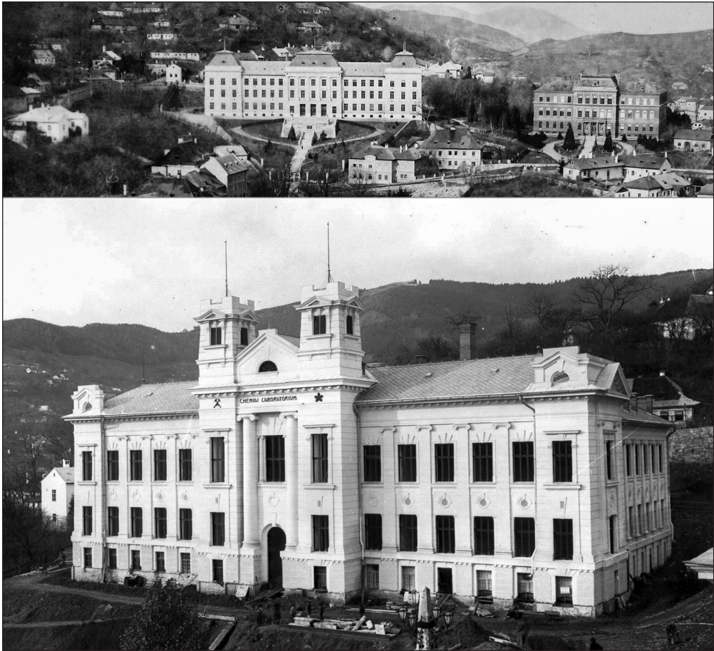
2. ábra. A selmecbányai Bányászati és Erdészeti Főiskolának a 19–20. század fordulóján emelt új épületei. A felső képen középen balra a bányászati, jobbra az erdészeti épület, az alsó képen a kémiai laboratóriumi épület; a kémiai épületet a felső képen a bányászati épülettől balra látható üres telekre szre húzták föl