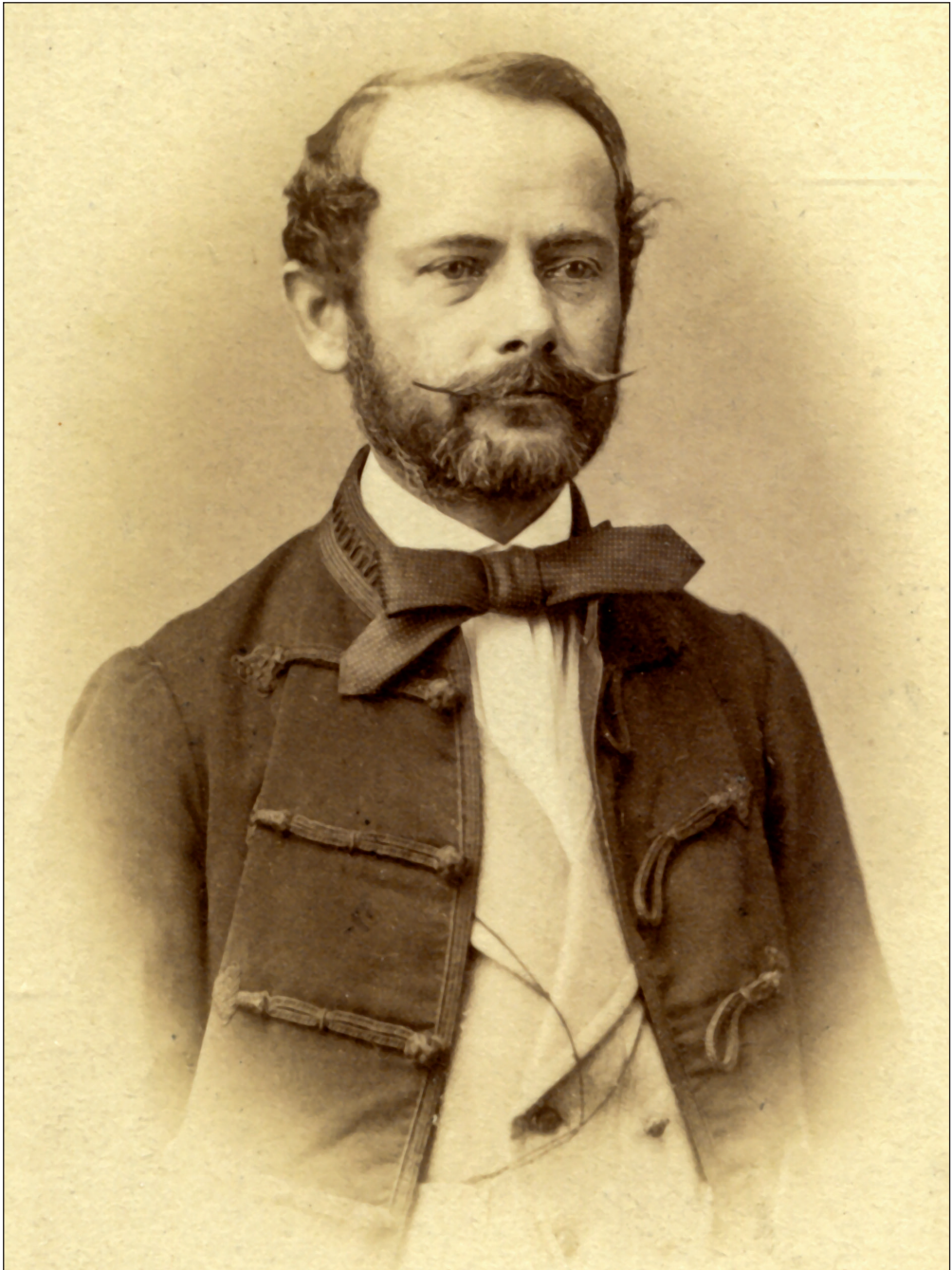
3. ábra. Szabó József geológus fényképe a Magyar akadémiai albumból (1865)