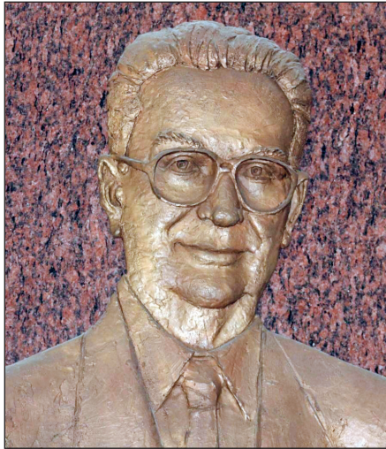
1. ábra. Györfi Sándor, Gergely János-emléktábla , Karcag