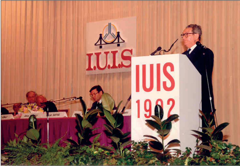
1. ábra. Gergely János a budapesti Immunológiai Világkongresszuson 1992-ben

választották. Aktivitása hozzájárult ahhoz, hogy 1992-ben Budapesten szervezték meg az Immunológiai Világkongresszust Nobel-díjas meghívottakkal és több mint 5000 résztvevővel (1. ábra).