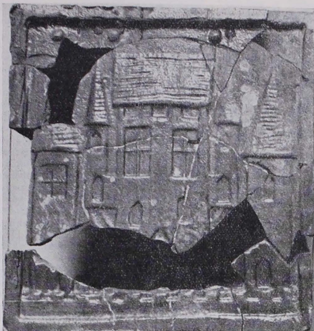
Zsigmond-kori kályhacsempe, a Hidegkútiútról. (Művelődéstörténeti Múzeum)

Печный Кирпиг из века Жигмонд, ул. Хидекути. (Культурно исторический музей.)