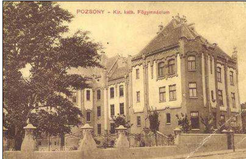
1. kép: A főgimnázium új épülete