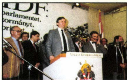
A választásokon győztes párt vezére, 1990. április 8.

1990. április 8. A választások második fordulójára egyértelművé teszi, hogy az új kormány vezető ereje az MDF, és a miniszterelnök Antall József lesz. A mandátumok 43%-át az MDF szerzi meg.