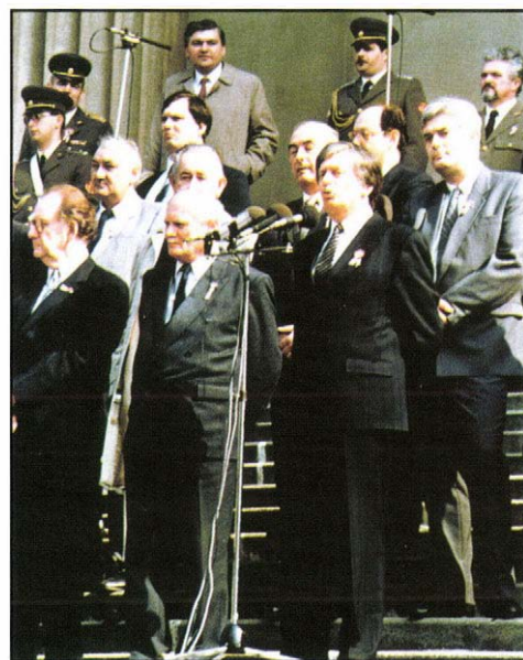
Amikor a nemzeti ünnepek még nem váltak a pártcsatározások színterévé. A közjogi méltóságok együtt emlékeznek, 1991. március 15.

A halott miniszterelnök ezt az európai és nemzeti liberalizmust tekintette életművének. Tanulmányaiba, nem éppen rövidre fogott konferencia-felhasználásaiba, no és baráti, társasági beszélgetésekbe öntötte bele otthonról hozott és tanulmányaiból merített eszményeit. Mondhatnánk – legalábbis az én 1990. év eleji naplómban így szerepel – „Antall Jósikából most a felszínre tört a harminc éve lefojtott nemzeti polgári liberalizmus. Az irodalmi termékekből most lesznek a politikai beszédek – írom –. Fiatalos szenvedéllyel éli meg ez a hatvanhoz közeledő férfi irodalmi hőseinek, Eötvös Józsefnek, a centralistáknak és atyáinak eszméit.” Ma, 2003 decemberében hozzáteszem: élete utolsó négy évében végre a gyakorlattal válthatta fel a tanulmányírást,