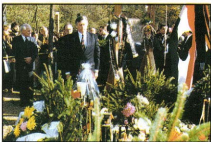
„Ötvenhat forradalma mindenkié”. 301-es parcella, 1990. október 23.

1990. október 25. Átlagosan 65%-kal drágul a benzin. Este megindul a taxisok országos tiltakozó akciója. Az ellenzék – elsősorban az SZDSZ – nyíltan a tiltakozók mellé állt. A válság lezárására Antall József kórházi betegágya mellől beszél a tévé nyilvánossága előtt az ország népéhez („pizsamás interjú”).