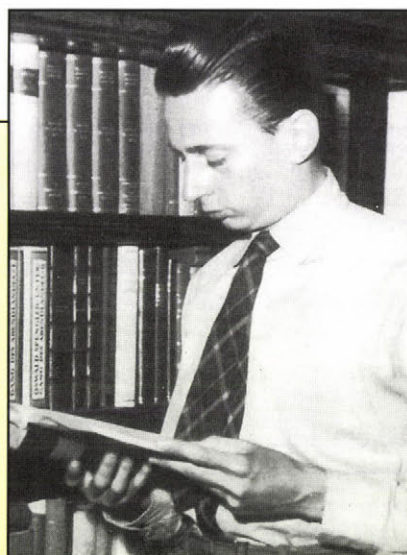
Neveltetése meghatározta későbbi politikai eszmerendszerét. Apa és fia: a volt államtitkár és a tanárjelölt

tori disszertációját (1969) Eötvös Józsefről írta. Történelem–magyar szakos tanár, levéltáros, később muzeológus és könyvtáros diplomát szerzett. 1954-ben a Magyar Országos Levéltárban, majd a Pedagógiai Tudományos Intézetben dolgozott. Tanári pályáját az Eötvös József Gimnáziumban kezdte 1955-ben.