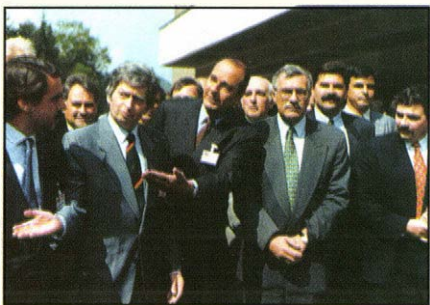
A már nagy beteg miniszterelnök jobboldali európai politikussal az EDU találkozóján

1993. szeptember 9. Budapesten ülésezik a Európai Demokrata Unió.