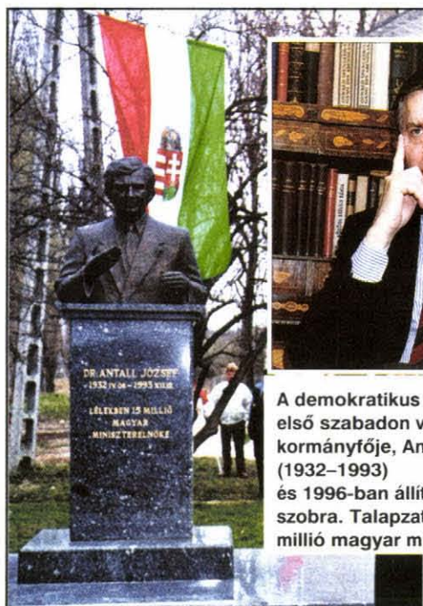
A demokratikus Magyarország első szabadon választott kormányfője, Antall József (1932–1993) és 1996-ban állított mányi köztéri szobra. Talapzatán: „Lélekben 15 millió magyar miniszterelnöke”

Antall József, az első, újra demokratikusan választott magyar kormány miniszterelnöke 1993. december 12-én meghalt. Három és fél éves kormányzása idején rögzült az alkotmányos parlamentarizmus Magyarországon, a többpártrendszeri demokrácia intézményes kerete. Személyes ügyének tekintette, hogy a tulajdonváltás, az azzal együtt járó szociális- társadalmi megrázkódtatások, a hatalomváltás, az elkerülhetetlen érdekösszeütközések ne az utcán, az elszabaduló indulatú tömegrendezvényeken csapjanak össze, hanem a parlamenti viták fegyelmezett rendje szerint folynak. Ezen három és fél év alatt nemcsak rögzültek az intézmények – tovább csiszolódott az 1989. október