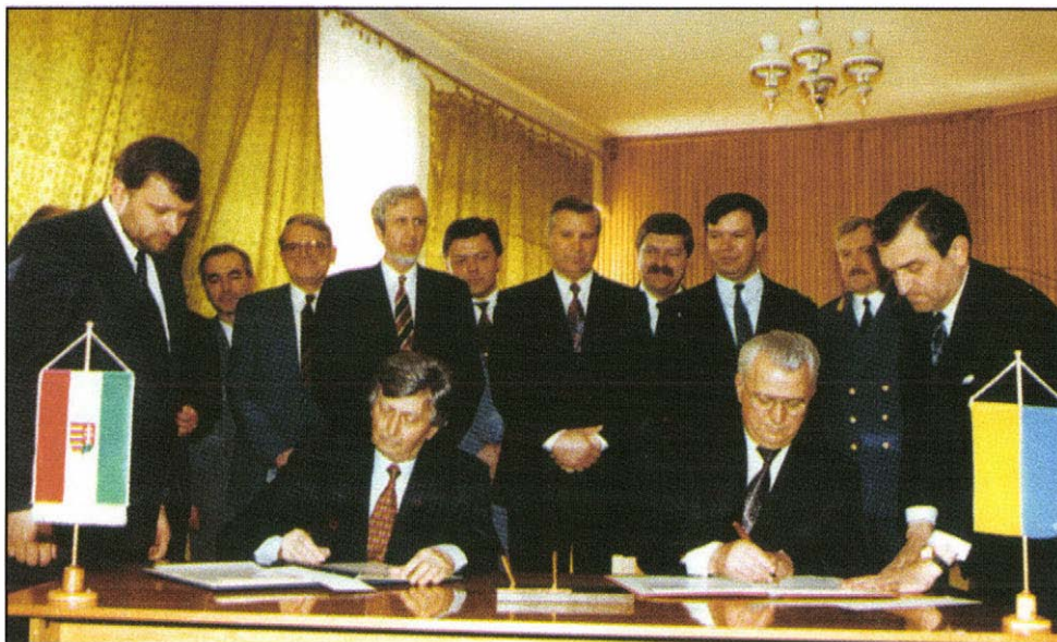
A magyar–ukrán tárgyalások záróokmányának aláírója. Munkács, 1993. április 30.

hogy a szovjet rendszer felbomlásában, belső felmorzsolásában ez az irányzat még nem eléggé méltatott, jelentős szerepet játszott. Magába fogta a proletárdiktatúra által visszaszorított nemzeti és világnézeti (így a vallásos) önazonosságot. (Ahogy a rendszer polgári radikális ellenzéke a politikai pluralizmus, az egyéni politikai szabadságjogok visszaszorítása ellen lázadt.) Azt azonban még nem látjuk, miért szenvedett ekkora vereséget 1994-ben az ezen értékeket zászlóra tűző csapat, és miért nem tud máig az 1990-hez hasonló jelentős erő lenni. Kérdés: talán túlságosan irodalmi formában, túlságosan múlt századi, vagy az 1945 előtti normák követésével jelent meg? Nem volt képes – ahogy például a német, a cseh vagy az angol tory párt képes volt – a régi középosztály nemzeti liberalizmusát modernizálni? Talán túlságosan is „történelmi”-ként jelenítették meg vezetői ezt az irányzatot a hódító computer, a tömegesség korában?