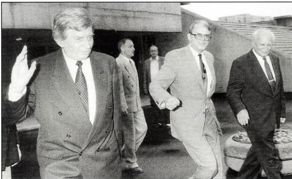
A rendszerváltás „hőskorában” gyakori vitára adott okot a közjogi méltóságok hatásköreinek tisztázatlansága. A miniszterelnök és a köztársasági elnök az Alkotmánybíróságról távozóban, 1992

elkötelezett kontinentális orientációt követett: német és francia súlyponttal. Műveltségével, ismereteivel ismét összhangban állt ez az irány. A hangsúlyos Európa-politikát párosította egy aktív Közép-Európa- és szomszédság-politikával. A visegrádi találkozó gondolati előzménye éppúgy megtalálható az Antall család ismert lengyelbarát (korábban antifasiszta) tevékenységében, a kutató Antall József különös vonalmában a lengyel témák iránt, mint az aktuális felismerésből: a magyarság jövőjének közép-európai meghatározottsága a szovjet megszállás után még erősebb lesz.