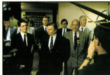
Látogatás a NATO-központban

1991. szeptember vége. Antall József a kelet-európai vezetők közül elsőként tesz látogatást a NATO brüsszeli főhadiszállásán, ahol Wörnerrel, a szervezet főtitkárával tárgyal közvetlen diplomáciai kapcsolat létesítéséről.