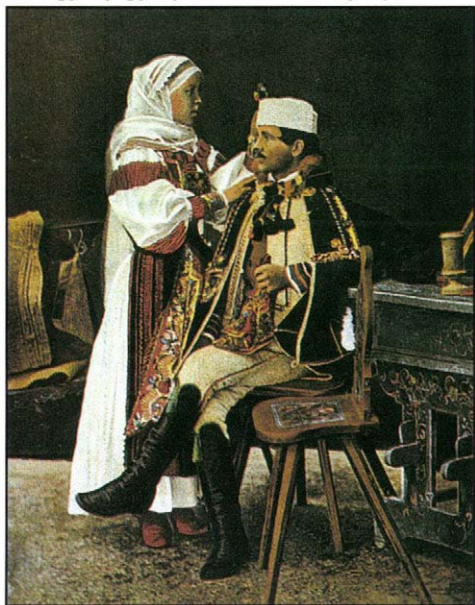
Magyar jegyespár. Színezett fénykép, 1910