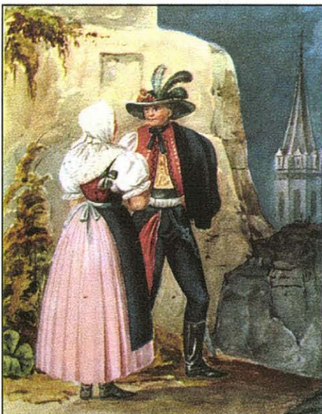
Horvát pár. Vízfestmény, 1840