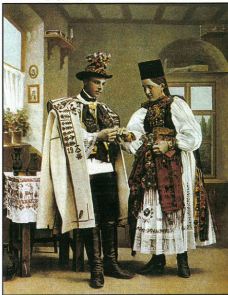
Szász jegyespár. Színezett fénykép, 1910