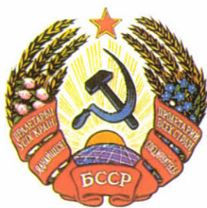
A „heraldika” azonos. A Szovjetunió belorusz, észt, úzbég, moldovai tagköztársaságainak címerei és a magyar változat

Nem figyelt fel még történetírásunk arra: hol és meddig állomásoztak szovjet csapatok a második világháború után, és milyen alapon. (A második világháborút lezáró magyar békeszerződés /1947/ értelmében Magyarországon azért maradhatnak 6 hónapnál hosszabb ideig megszálló csapatok, hogy az ausztriai szovjet megszálló erők utánpótlását biztosítsák. Ugyanilyen címen tartózkodtak Lengyelországban – ott a németországi megszálló szovjet csapatok utánpótlását biztosítva. Csehszlovákiából azonban már 1945-ben, Bulgáriából pedig 1947-ben kivontak!) Ausztria semlegességének kimondása előtt ugyan a csatlós országok létrehozta a Varsói Szerződést, de abban csak a segítségnyújtás lehetősége szerepel, mégpedig kérésre. És nem a megszállás meghosszabbítása. Itthon közbeszéd témája volt – a Szabad Európa Rádió is tudatosította –: az osztrák semlegesség kimondása után (1955. október 15.) Magyarországon jogalap nélkül állomásoznak a szovjet csapatok.