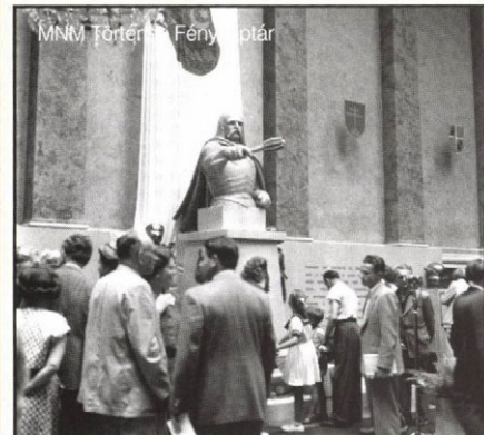
A Hunyadi János-emlékkiállítás megnyitója

augusztus 11. Hunyadi János halálának 500. évfordulója alkalmából a Nemzeti Múzeumban emlékkiállítás nyílik. A kiállítás része a nándorfehérvári diadal 500. évfordulóján rendezett nagyszabású ünnepegeknek. A megemlékezések alap gondolata: a térség népeinek összefogása és a külföldi betolakodók elleni harc.