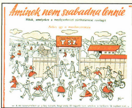
Karikatúra a tagosítás visszasságairól

július 20–30. Moszkvában a KGST-országok képviselői a haditechnikai eszközök és fegyverek gyártására kapott megrendelésekről tárgyalnak. (Koráb-