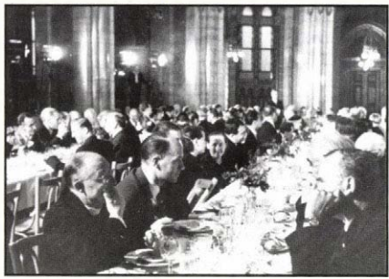
Az Egyházak Világtanácsának képviselői díszebéden a Parlamentben

július 28–augusztus 5. 1945 óta első ízben ülésezik Magyarországon az Egyházak Világtanácsa központi bizottsága, 30 ország nemzeti egyházának képviselőjében.