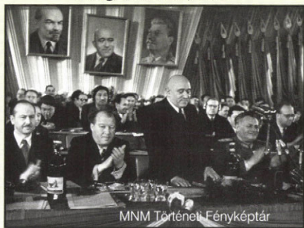
MNM Történelmi Fényképtár

Az állami függetlenség mintaképe 1956 őszén egyértelműen Jugoszlávia. (Noha 1955-től közbeszéd témája az osztrák semlegesség , különösen 1956 nyarától.) Déli szomszédunk valójában független állam, kommunista rendszerrel, de ügyesen lavírozva a nyugati, a szovjet és az Európán kívüli államok között. Attól függően, hogy nemzeti-állami érdekei mit kívánnak. Magyarország státusát is – a ránk maradt írások és szóbeli visszaemlékezések alapján – hasonlóan képelték el a diákok.