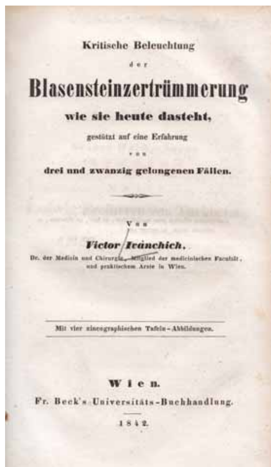
1. ábra | Ivánchich Viktor 1842-ben megjelent könyvének címlapja

A lithotripsia első klinikai fellendülése mégis Balassa János professzor nevéhez és iskolájához köthető. Az 1857-től megjelenő Orvosi Hetilap legelső, 2. és 3. számában szinte „vezércikként” jelent meg Balassa tanárnak „A húgykövekről hazánkban” című háromrészes sorozata. Az egész tanulmány a Wiener Medizinische Wochenschrift 25. és 26. számában látott napvilágot 1858-ban. Balassa végzett hólyag-hüvely-sipoly műtétet, amely ma is a nehéz műtétek közé tartozik. A hólyagszűkület kezelésével is foglalkozott, ez szintén az operatív urológia bonyolultabbjai közé sorolható. Az éternarkózt is ő vezette be Magyarországon 1847-ben. Foglalkozott a húgykövek kémiai analizisével, kőképződéssel. 1859-ben