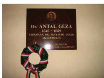
2. ábra | Antal Géza emléktáblája az Urológiai Klinikán

Antal Géza (2. ábra) 1846-ban Nagyenyeden született. Édesapja, Antal László a Bethlen-kollégium kórházának volt orvosa. Nagypja, Antal János Erdély református püspöke. Családjá 1849-ben a szabadságharc alatt elmenekült Nagyenyedről, amikor a környékére betörték a mócok (havasi románok) és igen nagy pusztítást végeztek a magyarság körében. Ennek esett áldozatul Vasvári Pál és huszárcsapata a Magyarvalkó alatti völgyekben. Az Antal család is elmenekült Nagyenyedről Marosvásárhelyre. Édesapja itt is városi orvos lett, és mint ilyen – valamint az egyházi és polgári közélet terén kifejtett buzgó tevékenysége következtében – nagy tekintélyre tett szert. Antal Géza 1865-ben lépett az orvosi pályára. A bécsi egyetem orvosi karára iratkozott be. 1870-ben Budapestre jött és itt fejezte be tanulmányait.