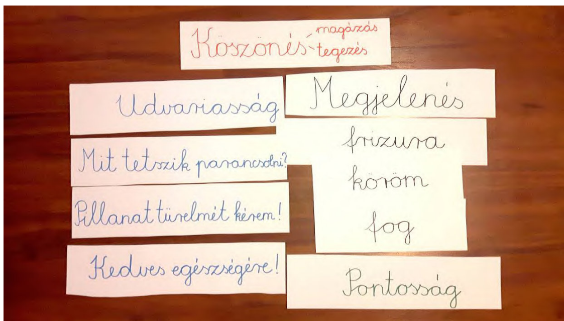
1. ábra: példa a felkészítés során alkalmazott szócsíkokra

Több alkalommal kimentünk a Caffé Sempre kávéházba, figyelve a felszolgálat folyamatait, ezzel párhuzamosan pedig egy-egy felszolgálatot klubtagjainkkal átvállaltunk, erősítve feladathelyzetbe hozásukat, enyhítve szorongásaikat. Hétről hétre érezhetővé vált fejlődésük mellett, munkában való teljesíteni akarásuk.