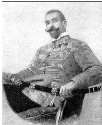
2. kép: Gróf Széchenyi Imre 28