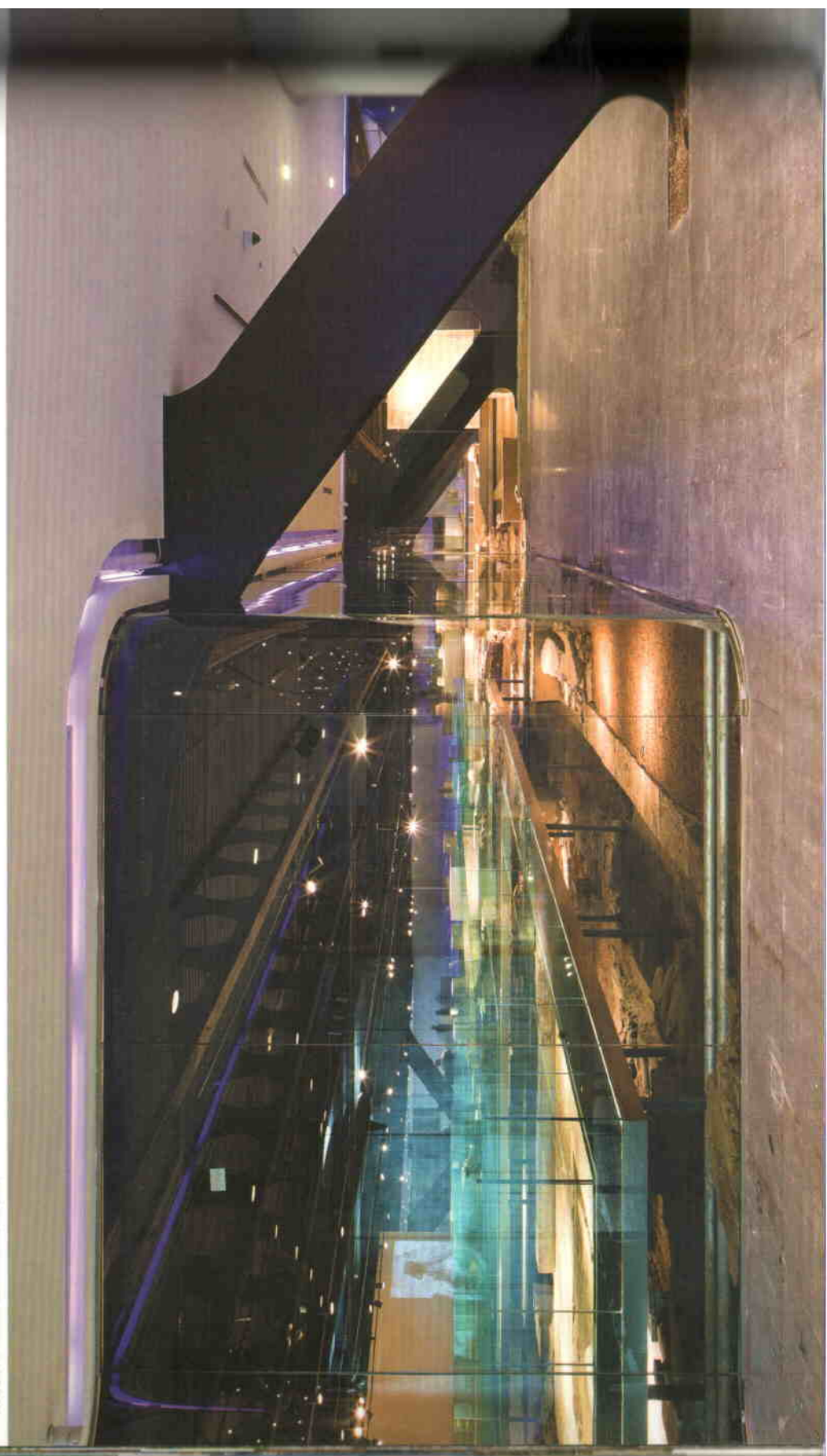
Metszet a római kori romok mentén

A különleges tartószerkezetet parametrikus szoftverek (Maya, majd a részletek megtervezésére Rhinoceros programok) segítségével definiálták pontosan. Az öncélú formavilág személyes érzékenysége racionális rácszerkezetbe nagyitva különleges technológiát igényelt. A rétegelt, ragasztott rácslemezeket összefeszítést biztosító acélkapcsok tartják helyükön, de valójában ragasztott kapcsolatokkal áll össze a teljes térlefedés. A falelementek az erős napsugárzás, az esetleges tűzhatás és a csapadék ellen speciális poliuretán bevonattal látták el. A felhőbe elemelkedett