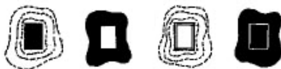
1. tömeg a térben 2. tér a tömegben 3. tér a térben 4. tömeg a tömegben