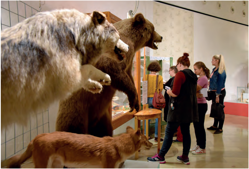
2. ábra. A látogatók rejtvényt fejtenek. Árgus tekintetek követik őket Fig. 2. Visitors filling in the quizzes – oblivious of the watchful eyes

Az állatok egy részénél megfigyelhető egy speciális érzékelés, amit „hatodik érzéknek” tekinthetünk: például a méhek és a vándormadarak a Föld mágneses terét is felhasználják a tájékozódáshoz, a kacsacsőrű emlősök pedig képesek érzékelni az elektromosságot is. Ezt is bemutattuk a látogatóknak, a körökön kívül, egy külön „szigeten”.