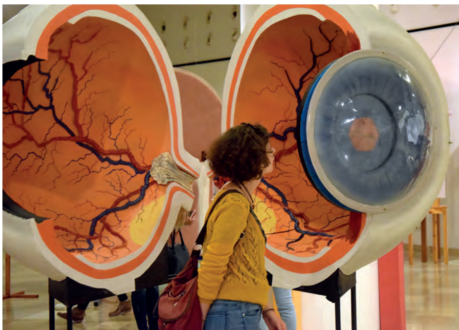
1. ábra. Egy óriás szem-makett a kiállításból