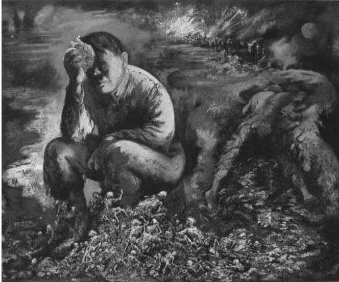
George Grosz: Káin vagy Hitler a pokolban

Itt keríthetünk sort a lelkiismeret – sokszor homályban maradó – kérdésének tisztázására. A keresztény hagyományban meglévő lelkiismeret szót a neokanti-