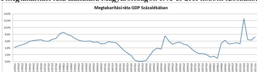
A megtakarítási ráta alakulása Magyarországon 1995 és 2011 közötti időszakban