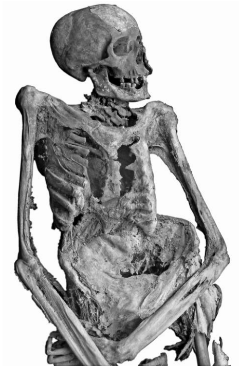
4. ábra: Nigrovits Antal (54. számú múmia) kachektikus teste. Fig. 4: Cachectic body of Antal Nigrovits (No 54).

gerincen kisebb mértékű, a háti gerincen nagymértékű (60 foknál nagyobb) scoliosis figyelhető meg. A nyaki és a háti szakaszon kyphosis is észlelhető (7. ábra). A súlyos deformációt fejlődési rendellenesség okozta és nem csonttuberkulózis.