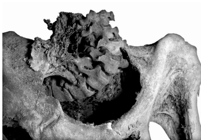
5. ábra: Deformálódott nyaki régió, közelebbi kép (54. számú múmia). Fig. 5: Deformed neck, a closer look (No 54).