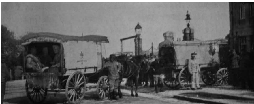
3. ábra. A kórházba sebesült katonák érkeznek