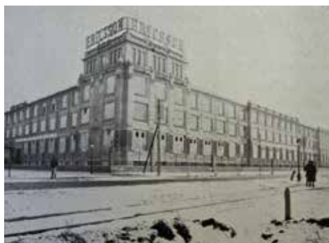
2. ábra. Az Ericsson új épülete