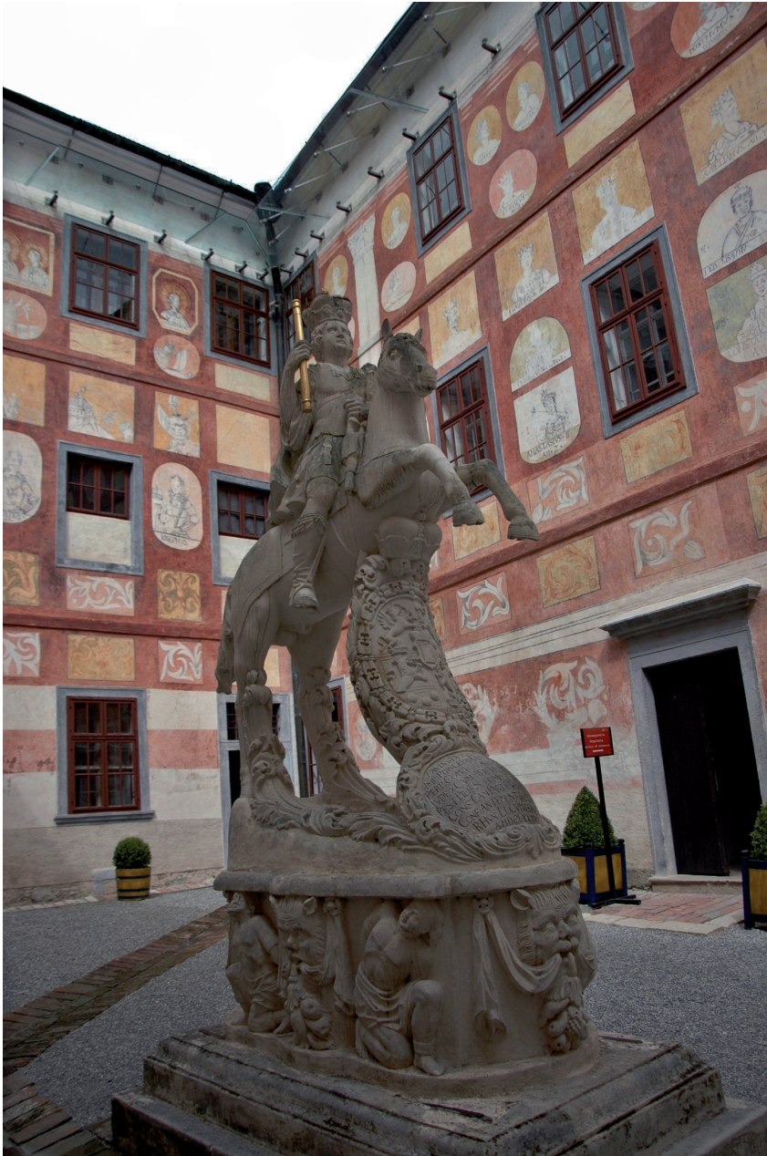
Michael Filser (Felser): Esterházy Pál lovas szobra, 1691. Fraknó vára