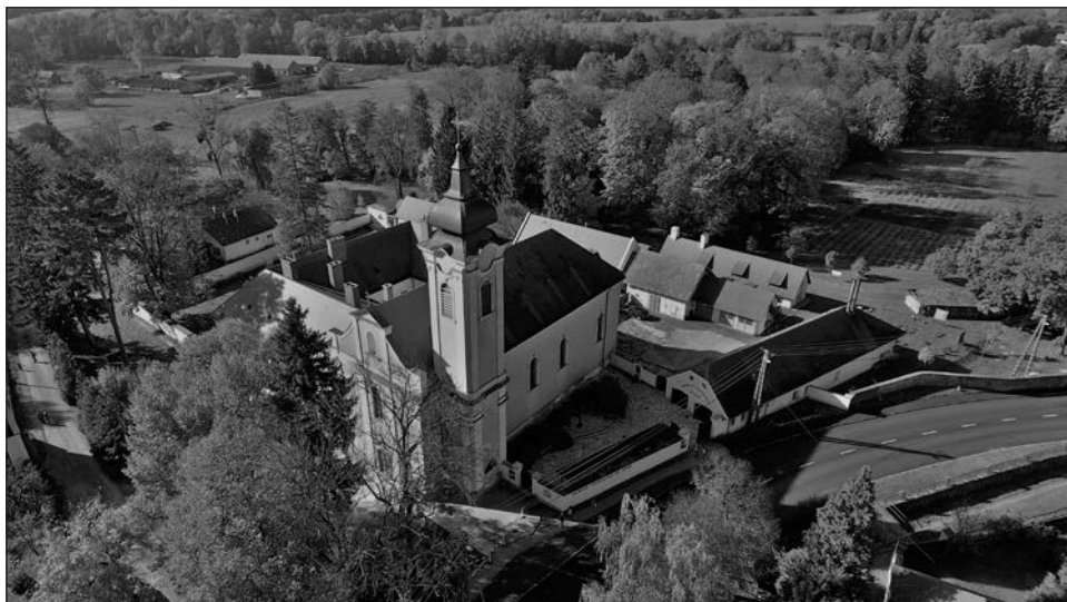
7. kép. A bakonybéli Szent Maurícius Monostor

valyi. Az idén – miként azelőtt – a szomszéd községek hívői processziókban zarándokoltak a borostyáni szent kúthoz. Bár a bakonybéli szent kút is, miként a csatka szent kút, egyházilag nem elismert kegyhely, mégis állandóan zarándokolnak ide az ájtatos hívők. A bábos sátrak, az olvasósok sátora és a szerencsejátékosok nyerő asztalai – a búcsúk fényének elmaradhatatlan, külső emelői most sem maradtak el. 43