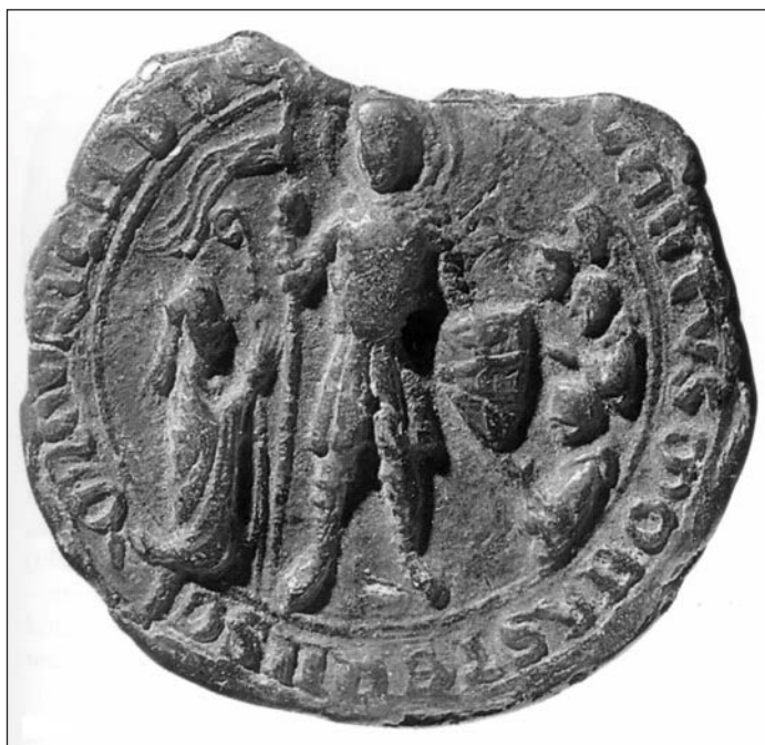
4. kép. A bakonybéli apátság pecsétje

A török kor előtti időkből Bakonybél mellett csak néhány olyan helységről tudunk, ahol Szent Móricnak szentelt templom állt, s mindet Veszprém megyében találjuk: Béb község, egy Berzsény nevű, elpusztult falu Tüskevár mellett és Hidegkút Veszprém közelében. 33 A török hódoltság után azonban, ha újjá is épültek ezek a templomok, már más védőszent tiszteletére emelték őket. Bakonybélen kívül egyedül a Zala megyei Csesztreg 13. századi Móric-temploma őrzi mind a mai napig ezt a titulust, ahová valószínűleg a bajor felmenőkkel rendelkező, alsó-lendvai Bánffy családdal való középkori kapcsolat miatt került a thébai katona kultusza.