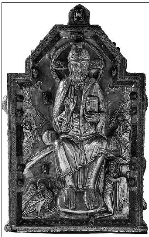
1. kép. Szent Móric ereklyetartója, 1100 körül (Apátsági kincstár, Saint Maurice d'Agaune)

A valószínűleg 534 után íródott Vita abbatis Agaunensis már úgy beszél Móricról és társairól, mint akik az oltár belsejében várják a feltámadást, fölöttük a szerzetesek kórusának örök dicsérete olyan, mint az angyalok kórusa. Ennek a hierarchiának olyan politikai töltete volt, ami komoly nehézségeket okozott az apátságnak azt követően, hogy Zsigmond burgund királyt 524-ben Chlodomir frank uralkodó meggyilkoltatta. 534-ben, amikor a frankok elfoglalták és felosztották a Burgund Királyságot, a thébaiak tisztelete mellett az apátságalapító Zsigmond burgund király kultusza is megjelent. A Szent Móric-apátság nemcsak a vértanú legionáriusok, hanem Szent Zsigmond király tiszteletének is központja lett, ami óriási befolyást és hatalmas vagyont biztosított a kolostornak. Frederick S. Paxton Szent Zsigmond csodatévő erejét és liturgiáját mutatja be válogatásunkban. A 6–9. század folyamán káprázatos liturgikus tárgyak áramlottak az apátságba, olyan páratlan kincsek, mint „Szent Márton vázája”, Teuderik kámeákkal és véssett drágakövekkel ékes ereklyeládája (2–3. kép), vagy Nagy Károly kancsója. 20