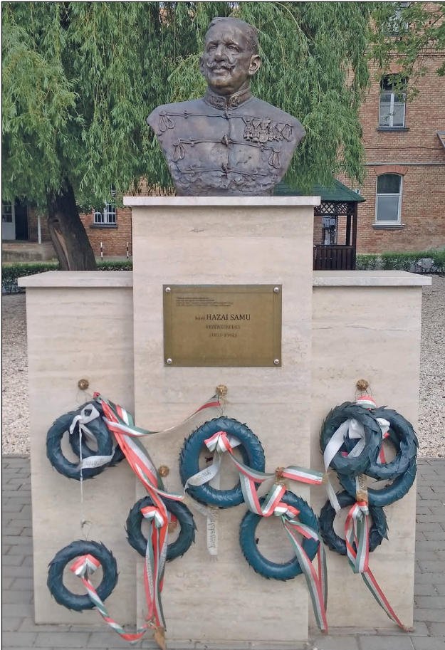
2. ábra. Bárány Hazai Samu mellszobra a Magyar Honvédség Logisztikai Központja bázisául szolgáló, a Soroksári út és Timót utca sarkán álló, történelmi jelentőségű objektum udvarán. A laktanya 2014-ben vette fel a tábornok nevét

Miért volt ennyire fontos a vallás kérdése a Monarchia korában? Mert a vallás sokkal nagyobb szerepet játszott az állam és ezzel együtt polgárai életében, mint ma. A vallás gyakorlása, a rituálékban való részvétel az élet természetes része volt. Állam és egyház pedig szorosan összefonódott egymással az élet szinte minden területén. A Monarchia hadserege a fentiekből adódóan nem pusztán a hon védelmére készítette fel katonáit, hanem gondoskodni tartozott tagjai lelki szükségleteinek kielégítéséről is. Ezért 1914–18 között a közös hadseregben és a Magyar Királyi Honvédségben 94 fő táborigazgató szolgált. Egy cél vezérelte a rabbikat és a honvédelmi vezetést is: olyan katonákat harcba küldeni, akik nyugodt lelkiállapotukkal képesek túlélni az ütközeteket. 7