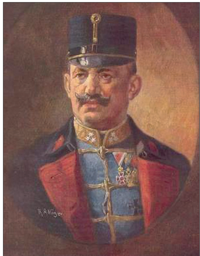
3. ábra. Bárány Hazai Samu vezérezredes arcképe

A képviselőházba a losonci kerület országgyűlési képviselőjeként jutott be. 1910. január 17-től 1917. február 19-ig a Khuen-Héderváry Károly, Lukács László és Tisza István által vezetett kormányban a honvédelmi tárcát irányította, majd a király belső titkos tanácsosa is lett. A Tisza-, a Fejérváry- és a második Wekerle-kormány alatt az ő elképzelései alapján történt a honvédelem fejlesztése. Megteremtette az új honvéd tüzérséget, két ágyús ezredet, nyolc önálló táborigazgató alakulatot hozott létre, kiváló katonai kodifikációs tevékenységet folytatott. Minden újítása, érdeme ellenére az ellenzéki politikusok a mindenkori „oszátrák” érdekek védelmezésével vádolták. A vádak szerint a Magyar Királyság Tisza gróf vezetése alatt egyre többet ad a közös költségvetésbe, háborús konfliktusok esetén pedig több katonát veszít, mint a birodalom más országai. Hazai állandó célpontja volt a döntően alaptalan vádaknak, de a