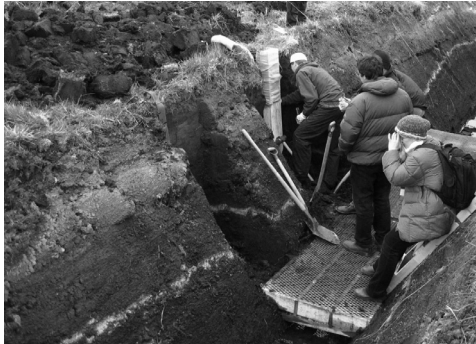
Andosol tefrával, Akureyri (Izland)