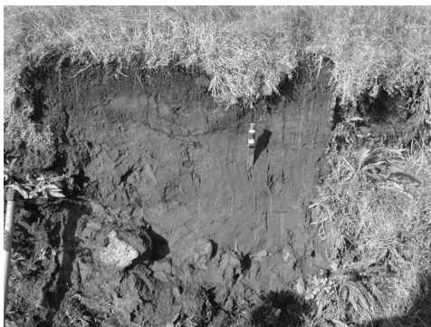
Andosol vulkáni hamun, São Miguel-sz. (Azori-szigetek, Portugália)