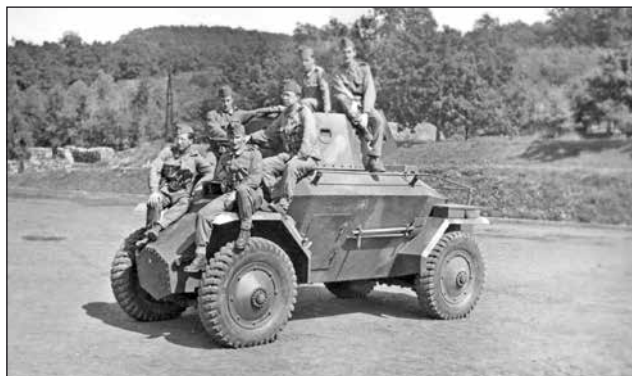
3. ábra. 39M Csaba páncélgépkocsi, tartalékos tisztekkel. Szintén a határvédelemben vett részt 1944 augusztusában és szeptemberében, a magyar támadás előtt

Aznap délután az 3/1. harckocsizászlóalj a parancsnoka öntevékeny elhatározása alapján, a 3/1. harckocsizászlóalj balszárnyát mentette meg a támadó szovjet harckocsiktól.