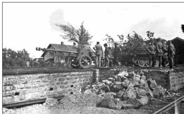
4. ábra. Pak 40 75 mm-es páncéltörő ágyú és RSO vontató kirakodása. Az eredetileg a román hadseregnek szánt fegyverzetet a magyar honvédség kapta meg a németektől

Szeptember 22-én délután az 1/1. gyalogzászlóalj sikeres ellentámadást indított a 10. rohamtüzér osztály 2. ütegével