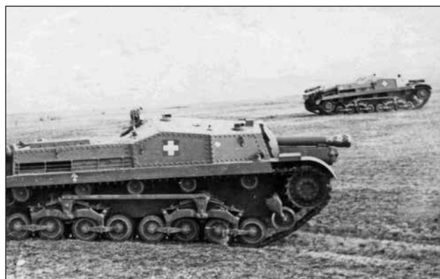
9. ábra. 40/43M Zrínyi rohamtarackok támadás közben

vinni, de a súlyosan sebesült százados összeesett és feltehetően maga kérte, hogy társai haladjanak tovább.