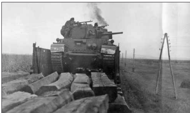
2. ábra. Improvizált páncélvonat 40M Turán harckocsival a határvédelemben, 1944 augusztus–szeptember

A 2. páncélosadosztály gépkocsizó lövészezrede három zászlóaljjal (4.,5.,6.) rendelkezett, a gépvontatású tűzérezdnek csak két könnyű tarackos tűzérozstálya volt. A hadosztályhoz még egy-egy légvédelmi tűzérozstály és páncélgéppágyús zászlóalj tartozott. A hadosztály ellátó oszlopához tartozott egy közepes páncélos-pótszázad is. A 2. páncélosadosztály nagyjából 140 db harcjárművel rendelkezett, ezek közül mintegy 100 db volt bevethető a támadás kezdetekor.