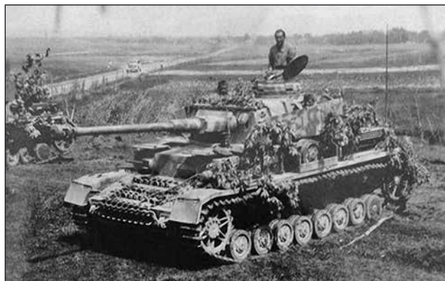
1. ábra. Panzerkampfwagen IV-es H harckocsi magyar személyzettel a 3. harckocsiezred kötelékében, 1944 szeptemberében

A 2. páncélos hadosztály 1944 áprilisától – az 1. magyar hadsereg kötelékében – a galíciai hadműveletekben vett részt, súlyos anyagi és személyi veszteségeket szenvedett. A jelentések szerint 1944 szeptemberében a páncélos hadosztály 14 db 38M Toldi könnyű harckocsival, 40 db 40M