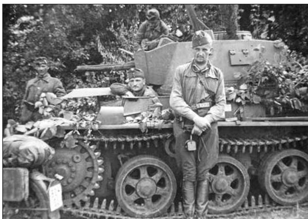
6. ábra. A 38M Toldi könnyű harckocsit a felderítőszakaszok állományában még szintén bevetették

1944. október 8-án a magyar erők megkezdték a visszavonulást Erdélyből. A következő napon a román páncéloscsoport, az Aranyos folyónál támadást intézett a 25. és a 26. magyar gyaloghadosztály állásai ellen. Az előrenyomuló román erők október 11-én elfoglalták Apahidát és összecsaptak a magyar harckocsikkal. A 2. páncélosadosztály súlyos anyagi és személyi veszteségeket szenvedett a tordai harcok során.