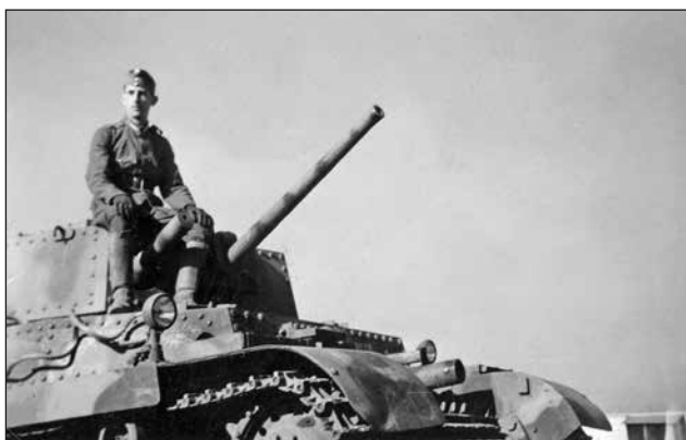
5. ábra. A 40M Turán közepes harckocsikat is bevetették az erdélyi harcokban